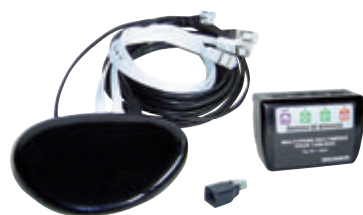
Kit box en ambiance Gbit FTTH (Q183)