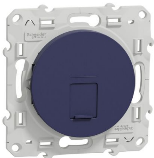
Va-et-vient lumineux Odace Schneider Electric - Cobalt Réf S550263