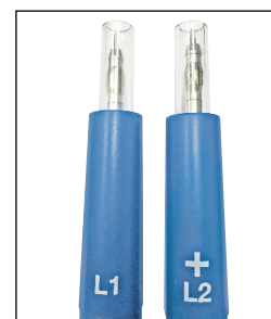
Pointes de touche IP2X