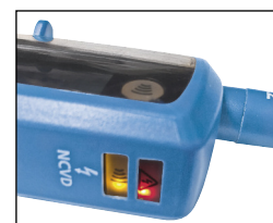
Double diode de sécurité et continuité