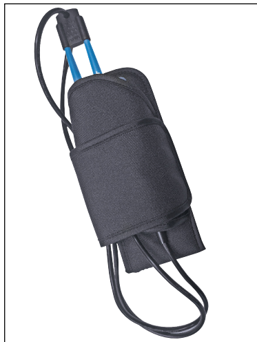
SC523: Etui ceinture