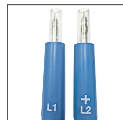
Pointes de touche IP2X

Le SEFRAM 66 est conforme à la nouvelle norme EN61243-3 et à la norme française UTE 18-510. Avec ses pointes de touches IP2X 4mm, l'utilisateur sera en sécurité en toutes circonstances. Le SEFRAM 66 est CAT III - 1000V et CAT IV - 600V. Il est équipé d'un autotest permettant de valider son fonctionnement et d'une double information de sécurité (en face avant et latéralement). Lecture directe sur un écran LCD rétroéclairé de la tension et de la polarité.