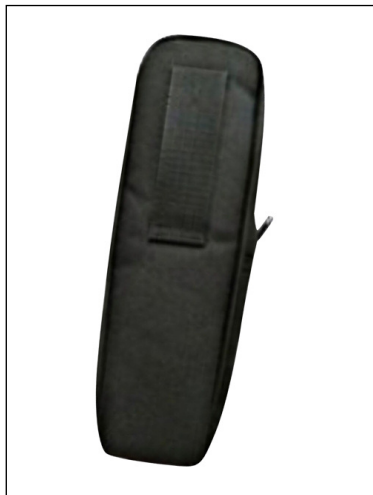
SC518: Sacoche de protection