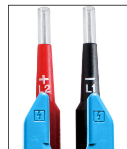
Pointes de touche IP2X (2mm et 4mm)