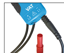
cordons pointes de touche détachables