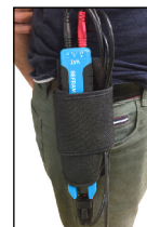
SC523 Etui ceinture