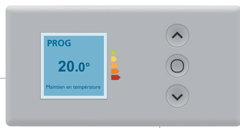
Commande digitale avec touches tactiles