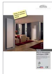
Kermi Verteo Prix et informations techniques I/2008

Kermi vous livre un système de chauffage à la pointe du progrès et un programme technique global répondant à toutes les attentes. Connectez-vous sur notre site Internet et demandez de plus amples informations.