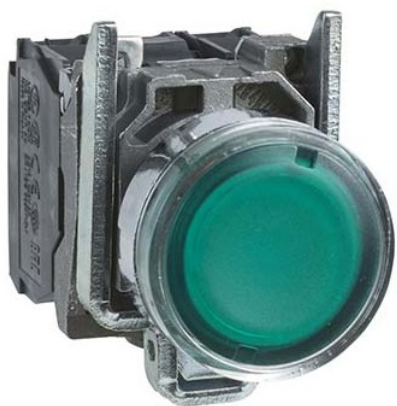
Poussoir lumineux LED - Harmony XB4 - 230 V - 1F + 1O - Vert Réf XB4BW33M5