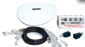
Kit box en ambiance 100 Mbit (LB015)

La box n'importe où, les médias partout !