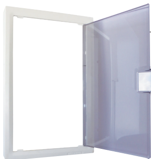
Habillage zone attenante (LB012)

Les habillages NÉO donnent une apparence moderne de mini-baie de brassage résidentielle au tableau de communication tout en le protégeant. L'habillage de la zone attenante est également utilisable pour recouvrir un coffret principal possédant un module d'extension au-dessus ou en-dessous.