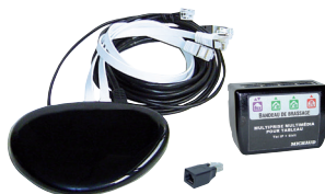
Kit box en ambiance 1 Gbit (LB016)

Les kits box en ambiance permettent l'installation de la box de l'opérateur de communication sur n'importe quelle prise RJ45 du logement.