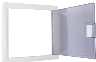
Habillage TDC principal (LB011)