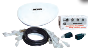
Kit box en ambiance 100 Mbit (LB015)

La box n'importe où, les médias partout !