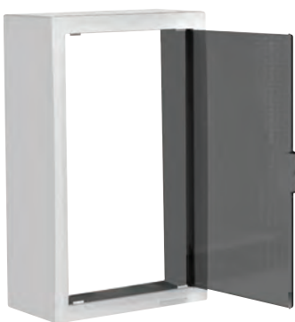
Habillage zone attenante (LB012)

Les habillages NÉO donnent une apparence moderne de mini-baie de brassage résidentielle au tableau de communication tout en le protégeant.