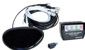
Kit box en ambiance 1 Gbit (LB016)

Les kits box en ambiance permettent l'installation de la box de l'opérateur de communication sur n'importe quelle prise RJ45 du logement.