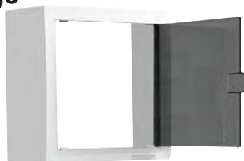
Habillage TDC principal (LB011)