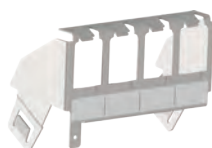
Support 4 RJ45 (LB017)