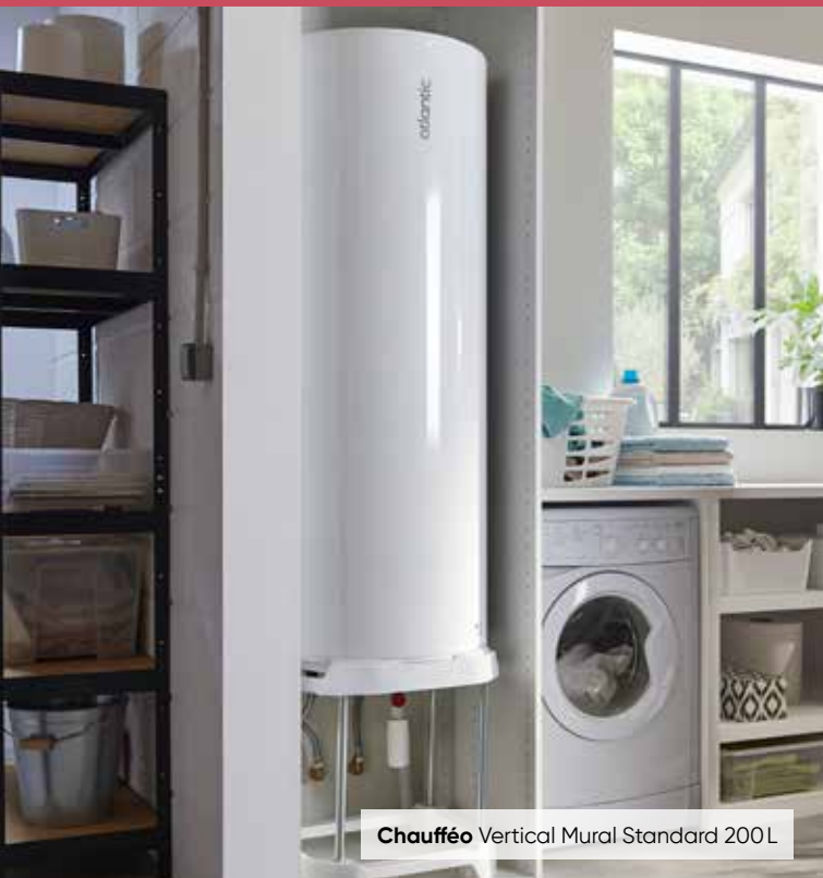
Chaufféo Vertical Mural Standard 200L