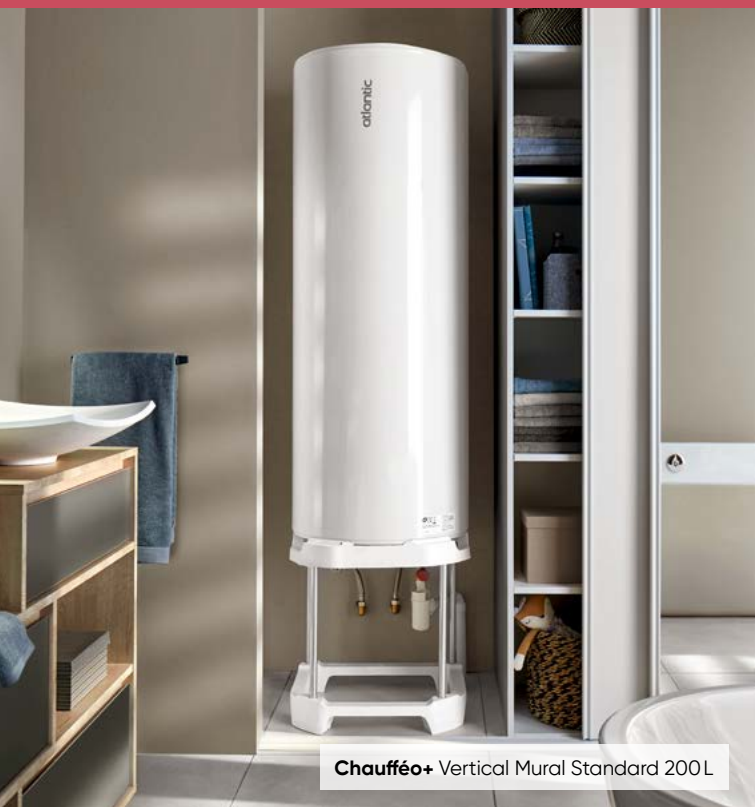
Chaufféo+ Vertical Mural Standard 200L