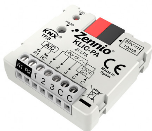
Passerelle Panasonic KNX Zennio - ZCLPA Réf ZCLPA