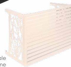
Gamme Initiale couleur crème