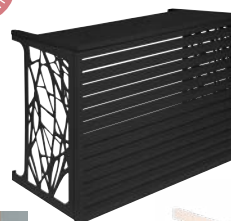
Gamme Confort couleur gris anthracite