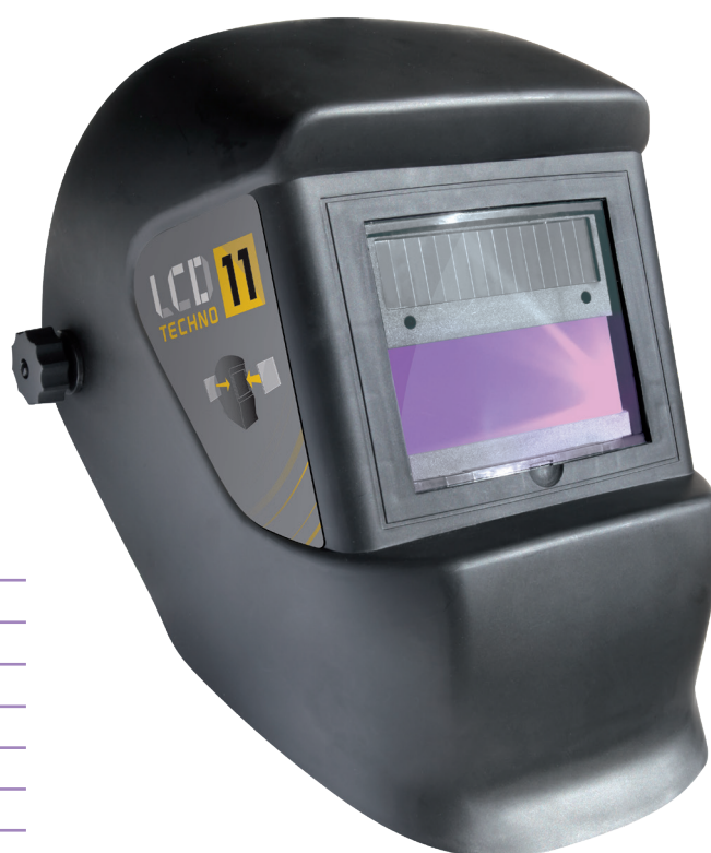
Livré avec un serre-tête