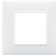
14642.01 - Plaque 2M techn. blanc