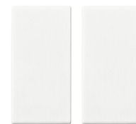
14506 - Touche 1M pour comm.RF blanc - 2 pièces