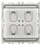
03906 - Commande RF Zigbee Friends of Hue