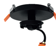
Réf : 100217 Encastré