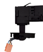
Réf : 100216 Fixation rail