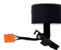
Réf : 100218 En saillie