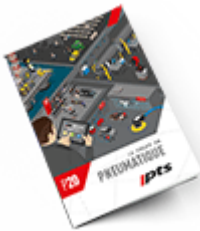
Pneumatique SAM 2020