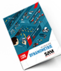
Dynamométrie SAM 2020