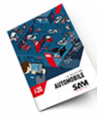
Automobile SAM 2020