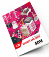
Sécurité anti-chute SAM 2020