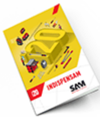
Les outils Indispensables SAM 2020