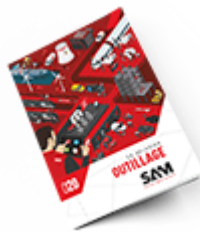
Outillage SAM 2020