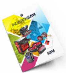
Les outils Indispensables SAM 2021