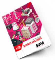
Sécurité anti-chute 2020