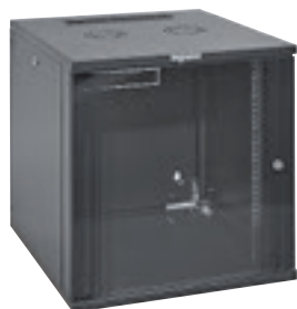
6 462 62