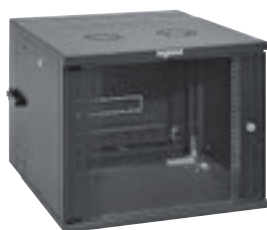
6 462 21