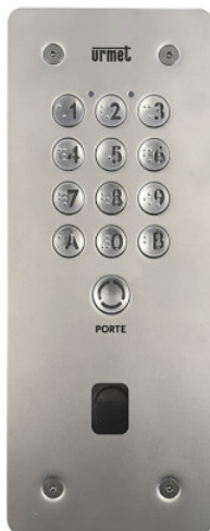
Clavier codé percé PTT/VIGIK Urmet Réf CE20IM54