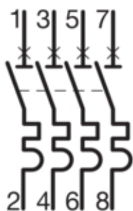
Photo non contractuelle. Référence présentée : NFN410