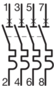
Photo non contractuelle. Référence présentée : NFN410