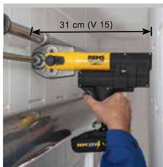
Produit allemand de qualité