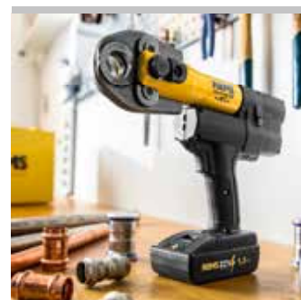
Tested by electrosuisse >>>