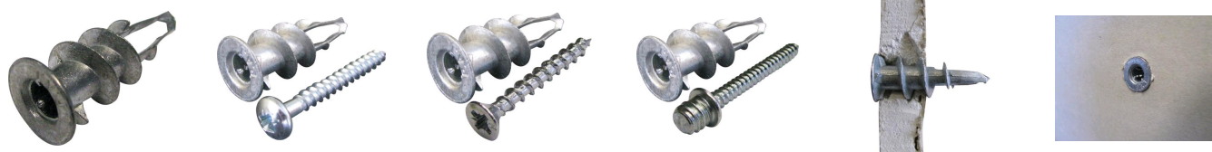
Cheville Plak métal