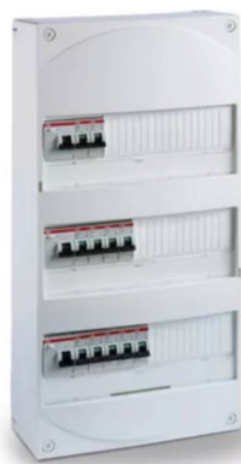
Tableau électrique prééquipé ABB - 3 rangées - 3 ID 63A + 11 disjoncteurs 4.5 kA