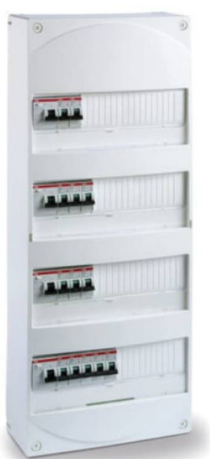
Tableau électrique prééquipé ABB - 4 rangées - 4 ID 63A + 13 disjoncteurs 4.5 kA