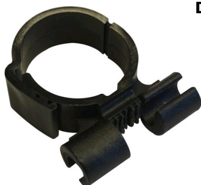
Collier Twist-Clip pour tige filetée