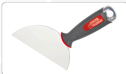
2615 - Couteau Plaquiste demi lune ALU-CHOC®