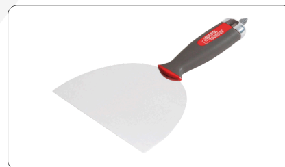
2783 - Couteau Plaquiste Embout de vissage