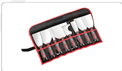
2433 - Trousse Plaquiste ALU-CHOC®