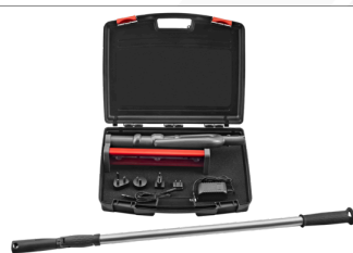
80401 - Lampe rasante sur Perche