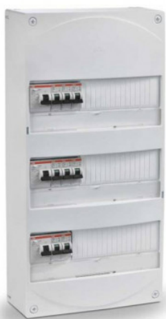
Tableau électrique prééquipé ABB - 3 rangées - 39 modules