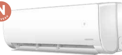
VERSION CHAUD SEUL SELON MODÈLE