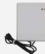
Platine interface pour le raccordement de la télécommande filaire WK-B