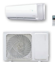
Réf CLIMATL01MMS Réf CLIMATL02MMS Réf CLIMATL03MMS Réf CLIMATL04MMS Réf CLIMATL01M