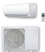
Réf CLIMATL02M Réf CLIMATL03M Réf CLIMATL04M

Voir les produits Atlantic : https://www.domomat.com/10_atlantic