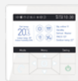
Télécommande filaire YR-E16A