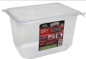
2684 - RECHARGE CAMION PULL LINER X5