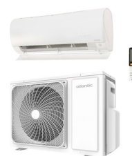
Réf PACMONOKAZ ENDO2.2