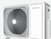
1U 018 JD