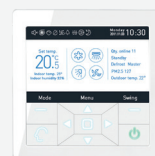
Télécommande filaire YR-E16A