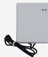
Platine interface pour le raccordement de la télécommande filaire WK-B