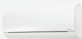
AS 007 à 018 JDB