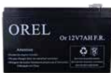
B7AH BATTERIE 12V 7.0 A/H