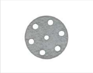
Eurocode 011204 Rondelle PULSA D.25