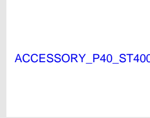
Eurocode 019336 Batterie PULSA 40 / P800 / IF / ST4