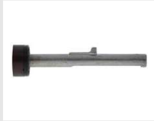
Eurocode 014641 Ens. porte rondelle P800-P40