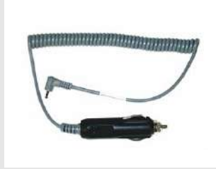
Eurocode 900507 Adaptateur voiture de chargeur