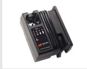
Eurocode 018482 Chargeur batt. EU PULSA / ST400i