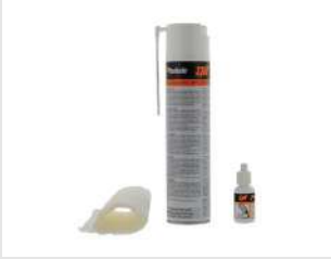
Eurocode 013690 Kit de nettoyage IMPULSE / PULSA