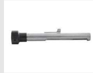
Eurocode 014642 Ensemble guide tampon magnet P800E