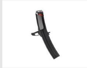
Eurocode 019683 Magasin 50 clous PULSA 40