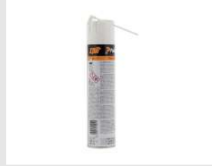
Eurocode 115251 Nettoyant IMPULSE & PULSA 300 ml