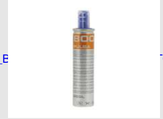
Eurocode 011773 BLI. 2 CART. GAZ PULSA / ST400i