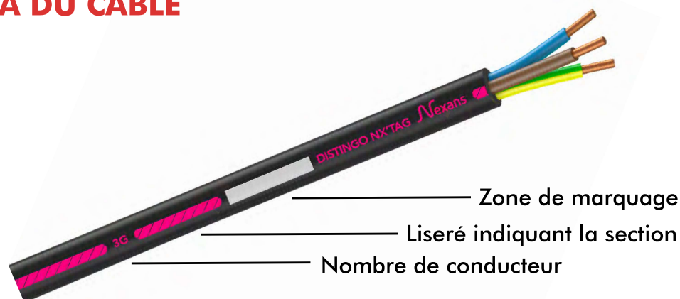
SCHÉMA DU CÂBLE