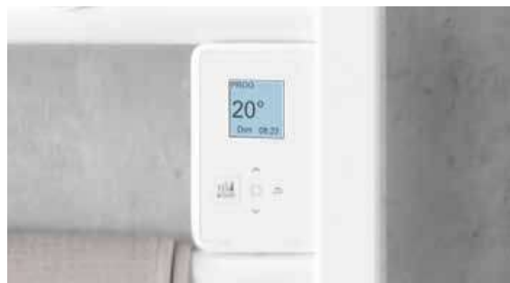
Boîtier digital tactile et programmable