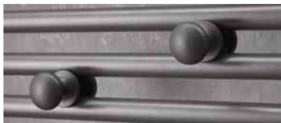
2 patères boutons amovibles