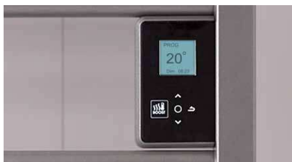
Boîtier digital tactile et programmable