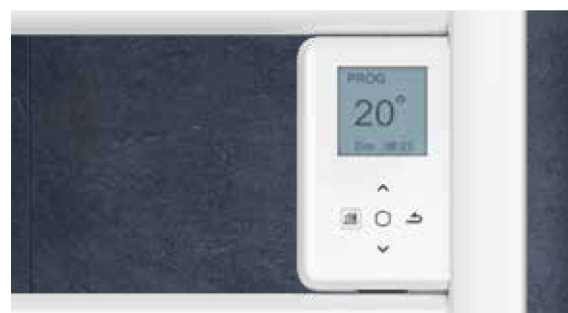
Boîtier digital tactile et programmable