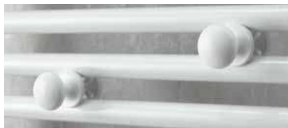
2 patères boutons amovibles