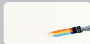
Blanc Quartz - Mimetic proche du RAL 9003

Blanc Cachemire / Quartz - Mimetic : vous pouvez peindre votre radiateur à la couleur souhaitée. Pour cela, assurez-vous d'appliquer au préalable une sous-couche de peinture spéciale pour surface qui n'absorbe pas l'eau. Puis la peinture de la couleur de votre choix. Les deux doivent être résistantes aux hautes températures.