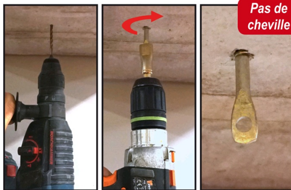
Percer Ø5 mm (Gain de temps)