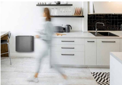
En semaine, vous partez le matin à 8h

Le radiateur gère les imprévus (départ en week-end ou en vacances), repère les retours anticipés grâce au détecteur de présence.