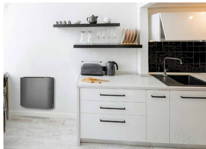
Pendant la journée, personne n'est présent