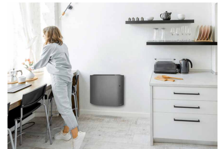
Vous rentrez le soir vers 19h