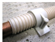
FIX-RING Simple - vue en situation