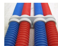
FIX-RING Quadruple vue en situation