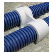
FIX-RING Double - vue en situation