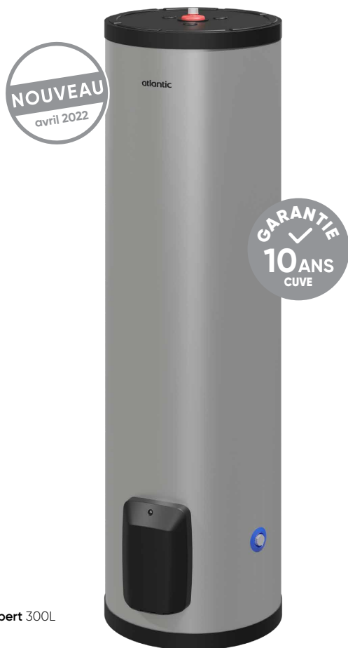
Inox Expert 300L

Robuste et durable il a été conçu pour répondre aux besoins en eau chaude sanitaire intensifs des professionnels. Inox Expert est adapté à tous les types d'eau et aux milieux difficiles.