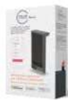
Module Anthracite NEN9241AAHS