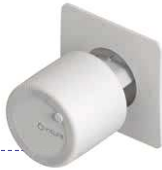
Passerelle intuis connect