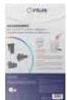
Kit Shunt NEN930AAA