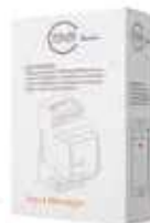
Aqua Manager NEN9501AA