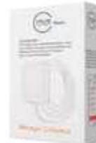
Manager Compteur NEN9291AA