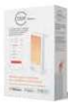
Module Blanc NEN9241AA