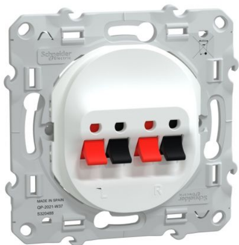
Prise haut parleur Ovalis Schneider Electric - 2 sorties - Encastré - Blanc Réf S320488