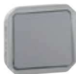
0 695 11L