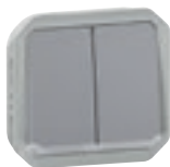
0 695 26L