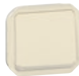
0 698 26L