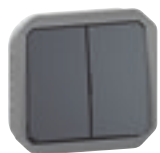
0 698 00L