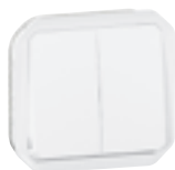
0 696 25L