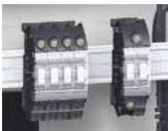
Possibilité de transformer le bornier en répartiteur d'arrivée jusqu'à 125 A, grâce au support PRA90048.