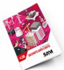
Sécurité anti-chute 2020