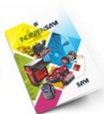
Les outils Indispensables SAM 2021

Découvrez tous nos produits dans nos catalogues en ligne