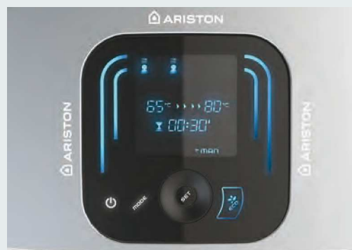
TABLEAU DE COMMANDE TACTILE ET INTELLIGENT